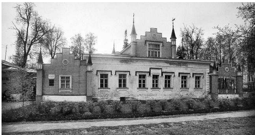
Извара, имение Рерихов под Санкт-Петербургом

дом. И все-то так мило, так нравится, тем-то и запомнилось через все годы.