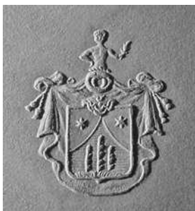
Герб семьи Рерихов