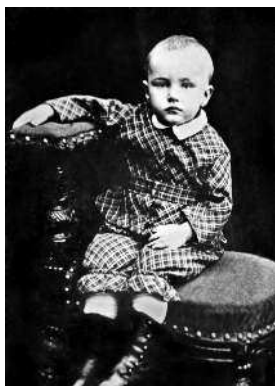
Самая ранняя детская фотография Николая Рериха. 1877

В семье Рерихов сохранилось предание о том, что один из генералов шведского короля Карла XII, воевавшего с Петром Первым, отказался выполнить приказ командования — уничтожить церковь, прикрывавшую атаку противника, — заявив: «С Богом не воюю». Этот мятежный генерал потом поступил на службу в российскую армию, за что император пожаловал ему имение недалеко от Костромы.